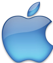
Mac OS X