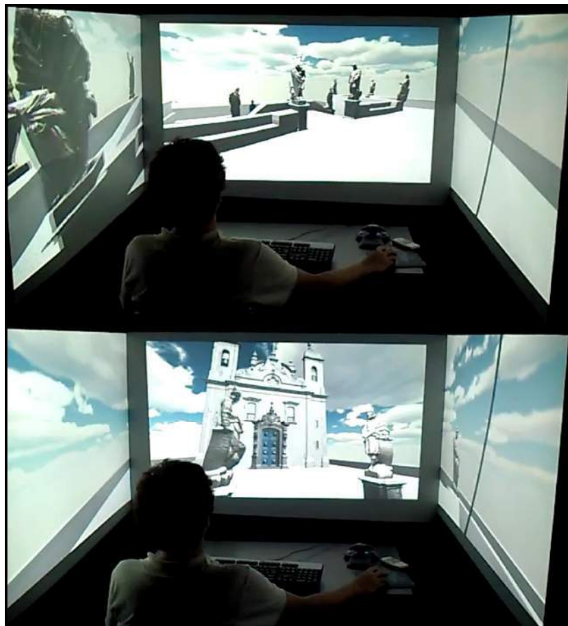
FIGURA 5 – Resultado interativo do projeto visualizado em uma caverna digital.