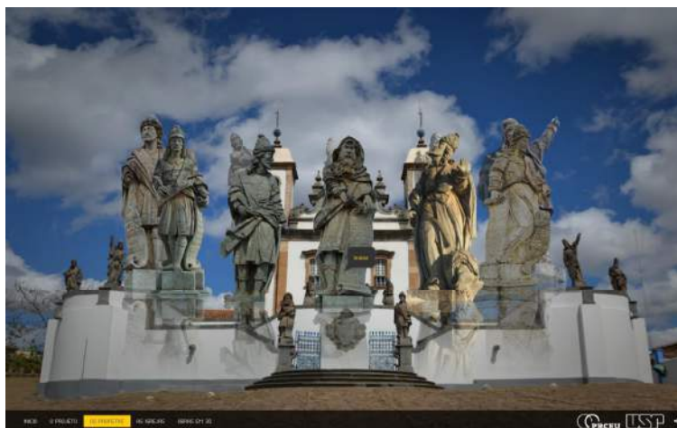
FIGURA 6 – Sítio do projeto Aleijadinho 3D ( http://aleijadinho3d.icmc.usp.br ).