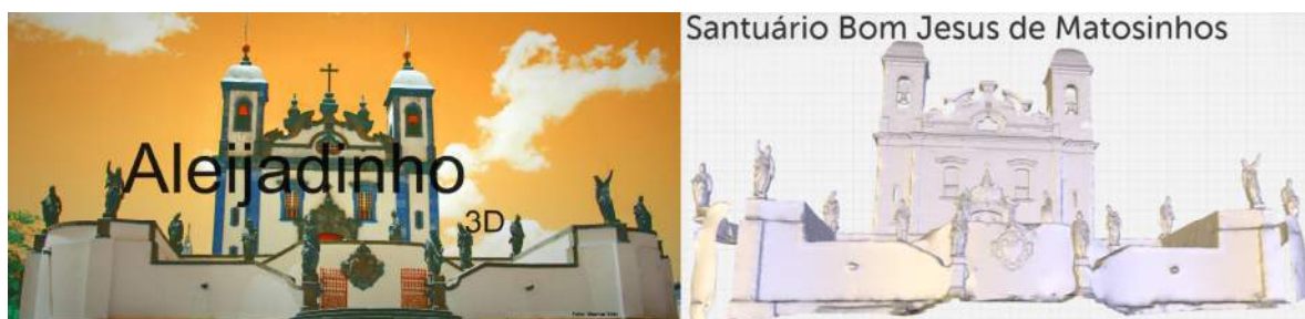
FIGURA 4 – Sítio de Congonhas (versão preliminar) já com todos os seus elementos em comparação com uma foto real.

A etapa seguinte foi a coloração das obras 3D. Esta etapa inicialmente exigiu que fotos de cada uma das obras fossem reunidas, frente e costas. Em seguida foi necessária a parceria com uma segunda empresa – a Imprimite ( http://www.imprimite.com.br/ ). Esta parceria foi necessária, pois o processo de coloração de malhas 3D a partir de fotos é bastante complexo, exigindo não apenas larga experiência como também softwares especiais de altíssimo custo. Assim, o processo de coloração foi usado no lugar do processo de texturização inicialmente previsto no projeto. Os resultados foram bem mais realistas, como se propunha alcançar no trabalho.