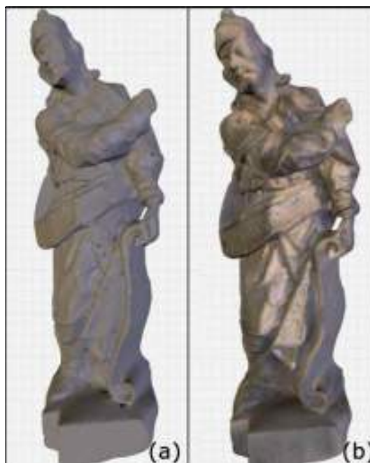
FIGURA 2 – (a) Estátua do profeta Ezequiel antes da coloração. (b) Resultado do processo de coloração.

original. Para esta etapa são necessárias fotos a partir de diferentes ângulos de cada uma das obras (frente e costas), as quais são usadas para definir a aparência em cada triângulo da visualização 3D – veja a Figura 2. Note-se que um processo parecido a este é denominado de texturização; diferentemente, neste projeto, usou-se o processo de coloração, o qual traz resultados mais realistas.